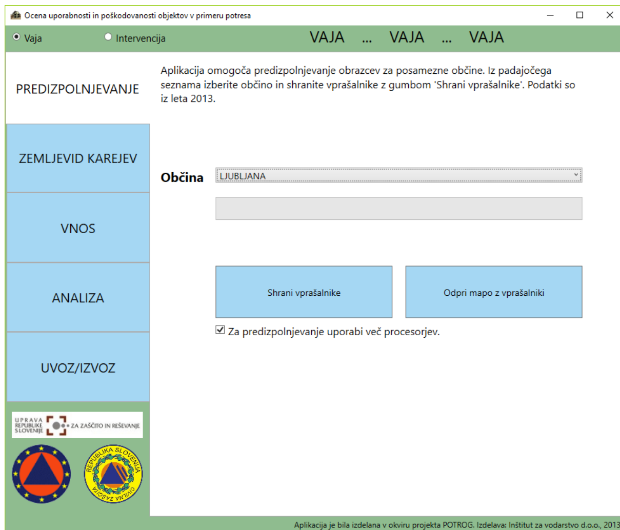
Slika: Prikaz izdelane aplikacije

USB ključki z pred instalirano aplikacijo se nahajajo na lokaciji URSZR v Ljubljani.